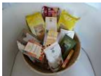
Fair Trade Produkte

Für alle Informationen und maßgeschneiderte Kursangebote besuchen Sie die ARARAT Akademie im Internet.