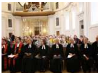
5 neue Gehörlosenfarrer/innen

Ihr Team der Evang.-Luth. Gehörlosenseelsorge Bayern