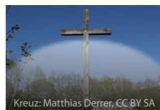
Kreuz: Matthias Derrer, CC BY SA