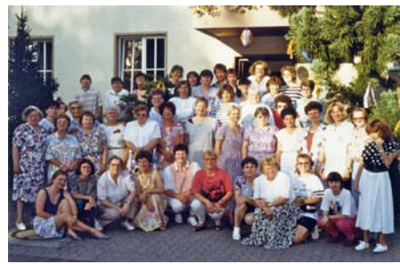
Die Frauen des Frauentreffs vor 40 Jahren