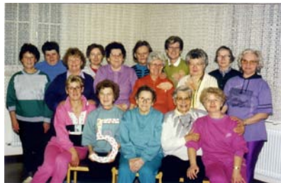
Die Bewegungsgruppe vor 20 Jahren

Fax: 0911/214-1322, E-Mail: sozialverwaltung@egg-bayern.de